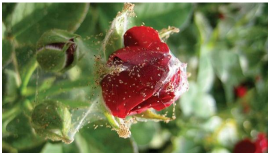
Acarieni (Păianjenul roșu)