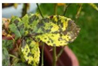
pătarea neagră la trandafir