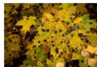
pătarea neagră la arșar