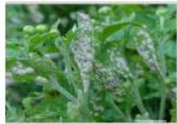
rugina la crizanteme