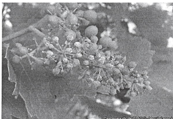
Mana ( Plasmopara viticola )