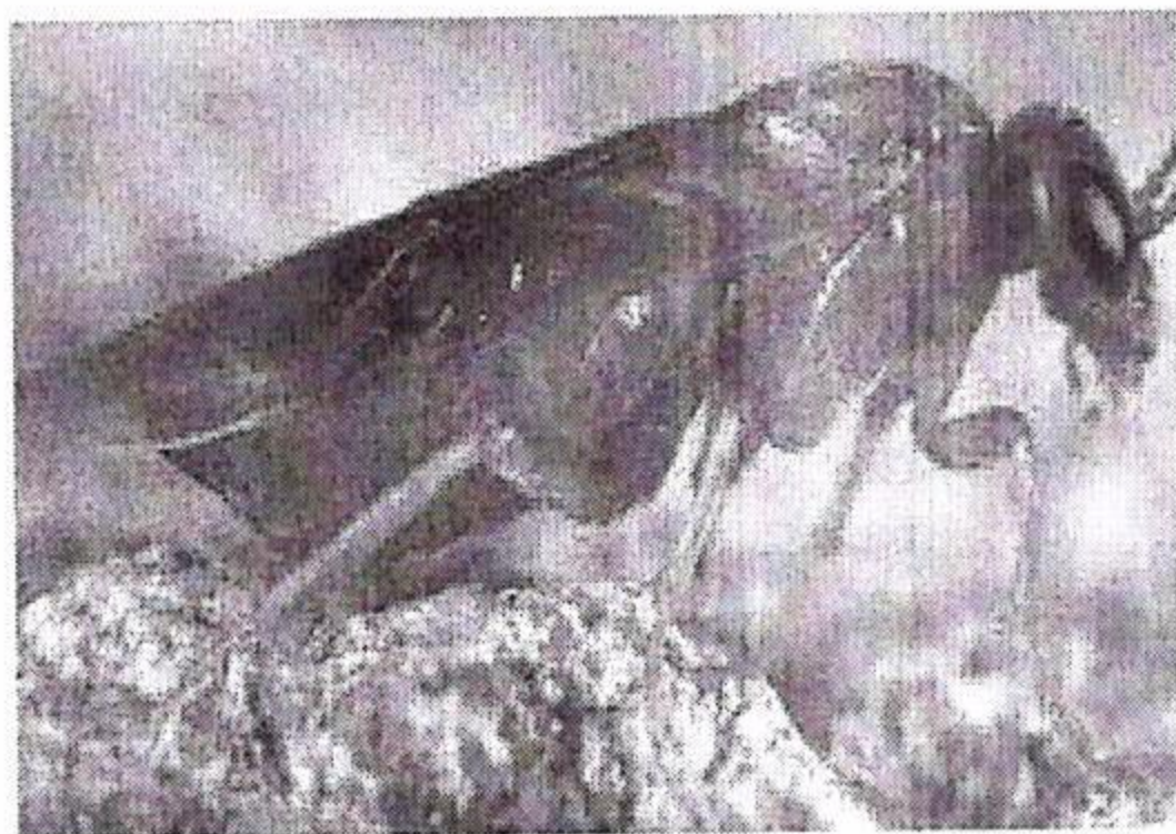
Viespea neagră a prunelor

Boli : Monilioza ( Monilinia spp), Ciuruirea ( Coryneum beijerinckii , Pătarea rosie ( Coryneum beijerinckii ) deformans), Băsicarea frunzelor de piersic ( Taphrina deformans ) Dăunători : Viespea neagră a prunelor ( Hoplocampa spp.), Cotarul brun ( Erannis defoliaria ), Cotarul verde ( Operophtera brumata )