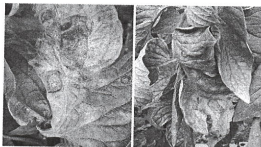
Alternarioza la tomate