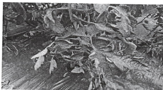
Ofilirea bacteriana a tomatelor