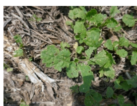
atac de purici