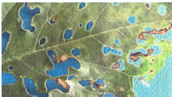
Ciuruirea micotică ( Coryneum beijerinckii )