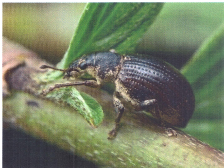
Gărgărița mugurilor ( Sciaphobus squalidus )