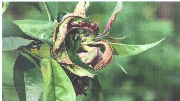
Bășicarea frunzelor ( Taphrina deformans )