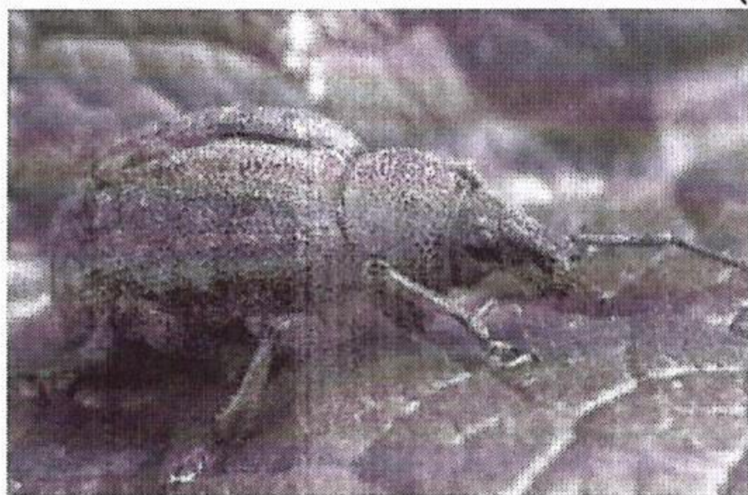
Gargarita florilor de mar